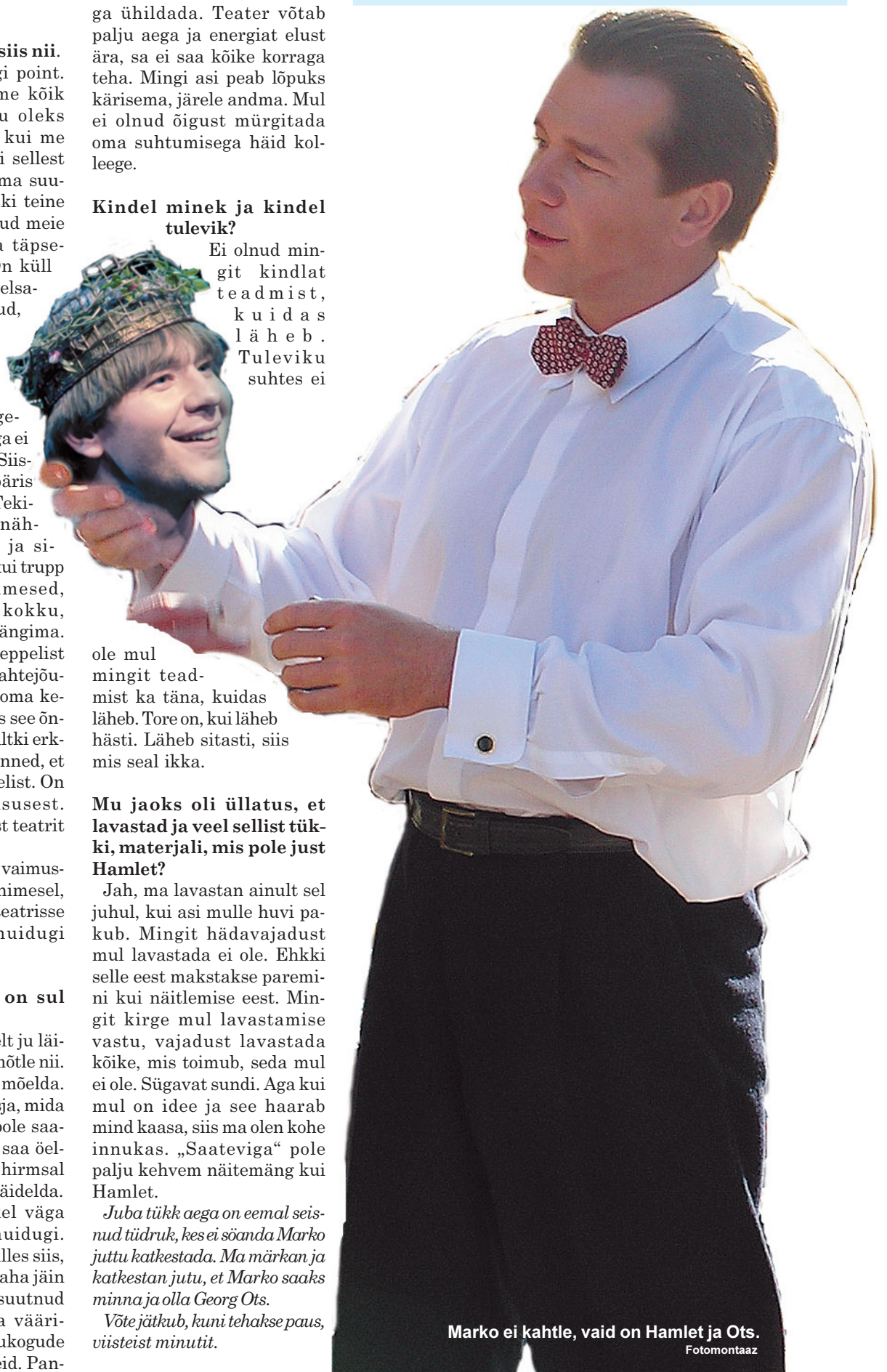
Marko ei kahtle, vaid on Hamlet ja Ots. Fotomontaaz